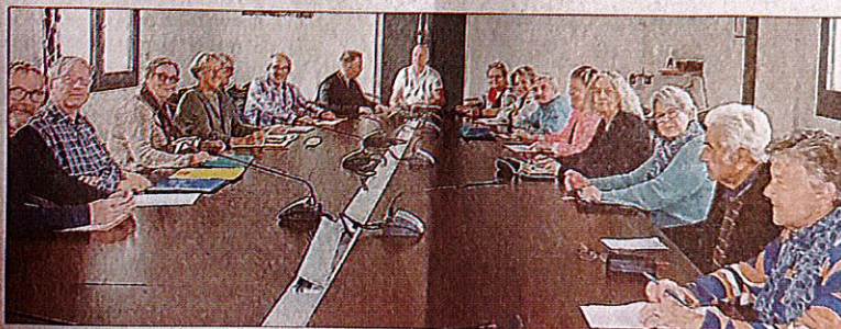
Par son avis et ses études, le conseil des Sages éclaire le conseil municipal sur différents projets intéressant la commune et apporte une critique constructive à la vie de la cité.

Il faut rappeler que le conseil des Sages est une instance de réflexion et de propositions. Par son avis et ses études, il éclaire le conseil municipal sur différents projets intéressant la commune et apporte une critique cons-